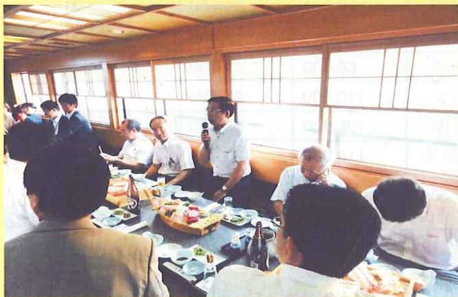
【仲野理事長ご挨拶】