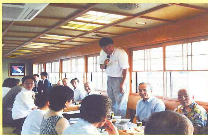
【小菅共済部長ご挨拶】